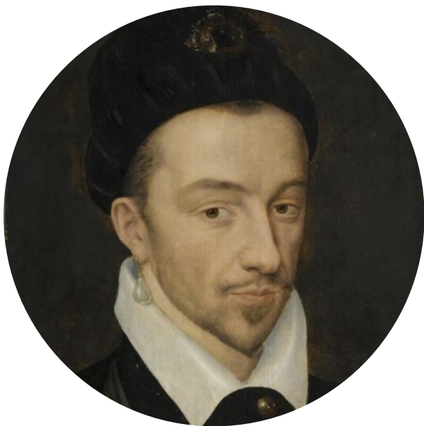
Clément Janequin (ca.1495 – ca.1560)

He was a French composer, author, musician, creator, performer, arranger, and translator of the Renaissance, he is considered to be one of the most famous composers of French song or chanson and is often described as one of the great masters of polyphonic song and programmatic music; his fame is credited to the development of printing and music publishing. (6,7,8,9,10,12)